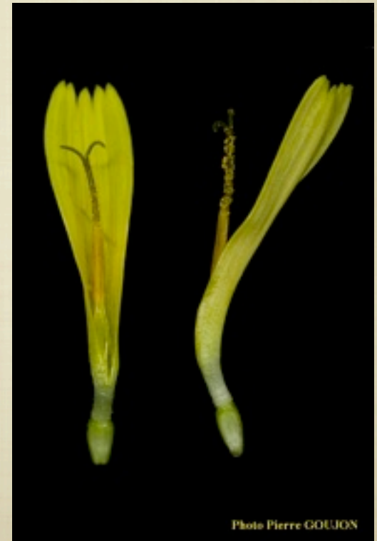
Fleurs en ligules avec pistil et étamines